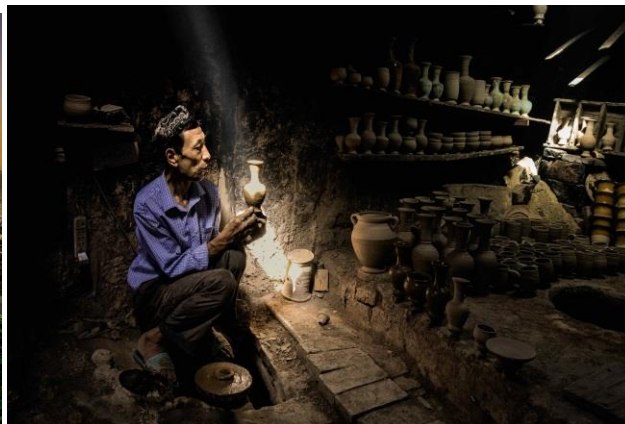
(左图)《印度尼西亚海神庙》，2018年作（原照片摄于2010年），彩色摄影印于日本美术纸，90 x 70公分 (右图)《新疆喀什》，2018年作（原照片摄于2017年），彩色摄影印于日本美术纸，90 x 70公分