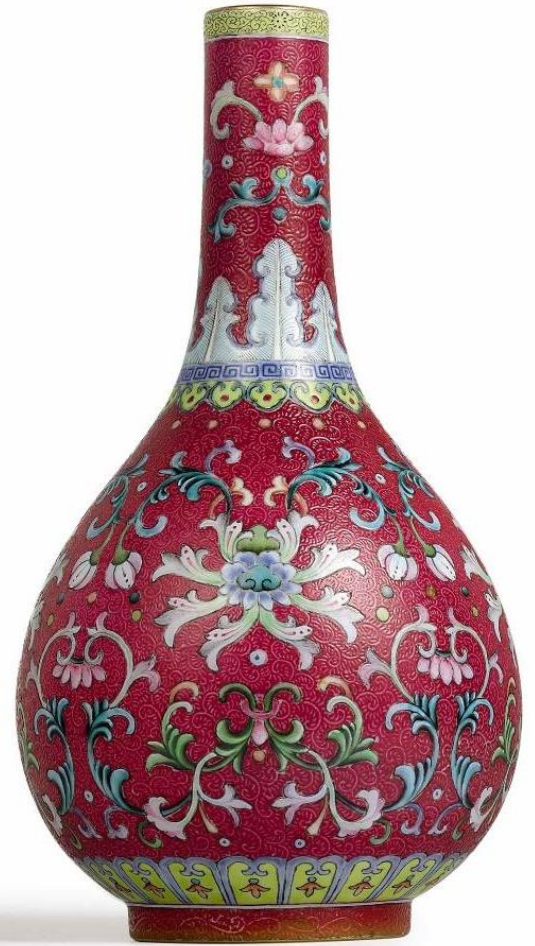
清乾隆 紫红地洋彩轧道锦上添花胆瓶 《大清乾隆年制》款 估价: 4,000万-6,000万港元