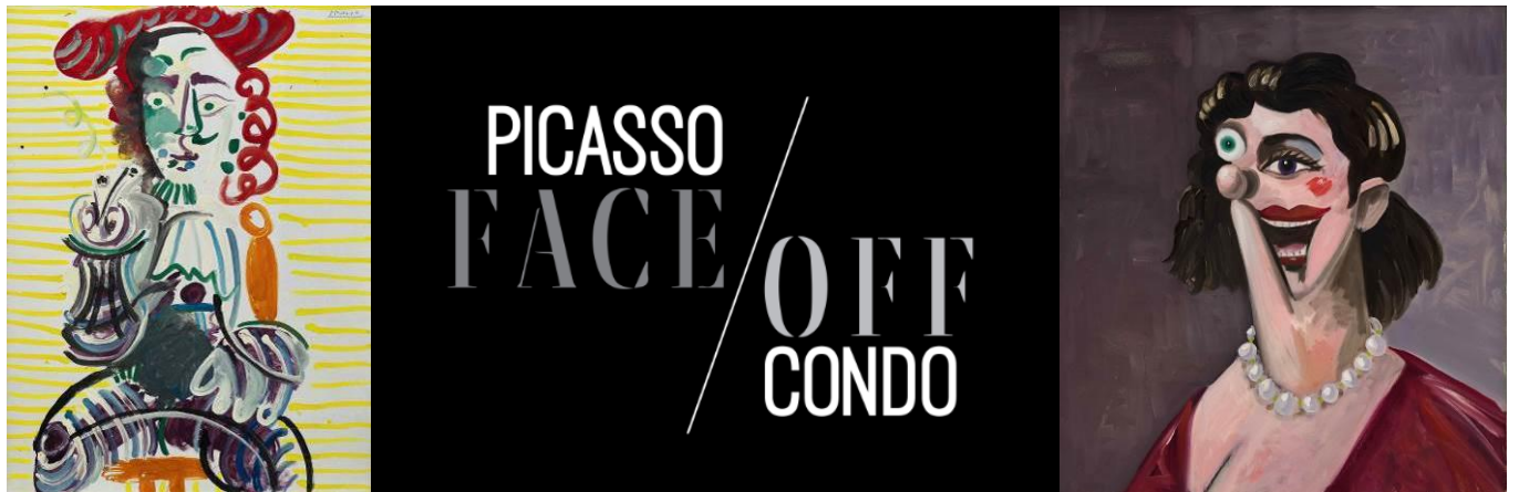
(左) 巴布罗·毕加索《拿烟斗的男子》，1968年作，油彩画布，130 x 97公分 © 2018 Estate of Pablo Picasso Artists Rights Society (ARS), New York (右) 乔治·康多《公主》，2008年作，油彩画布，101.5 x 92公分 © George Condo Artists Rights Society (ARS), New York