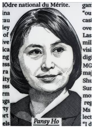
(左) 何塞-瑪麗亞·卡諾《華爾街 100—何超瓊》2017 年作，蠟彩畫布，212 x 151.5 公分 (右) 何塞-瑪麗亞·卡諾《華爾街 100—馬克·朱克伯格》，2017 年作，蠟彩畫布，212 x 151.5 公分