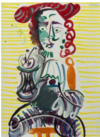
(左) 巴布羅·畢加索《拿煙斗的男子》，1968年作，油彩畫布，130 x 97公分 © 2018 Estate of Pablo Picasso Artists Rights Society (ARS), New York