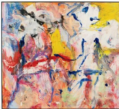
威廉·德庫寧《無題》，1977 年作，油彩畫布，137.1 x 152.4 公分

展出西班牙藝術家卡諾最為人所知的〈華爾街 100〉系列及〈金錢靈魂〉系列。藝術家以《華爾街日報》的矚目風格，重塑世界各大金融界名人鉅子；後者則以大尺幅，鉅細無遺地展現重要貨幣的肌理。藝術家透過作品對資本主義世界作出評論，探討金錢世界對人類文明的影響。詳情請 按此 。