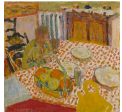
皮耶·博納爾《瑪特與狗坐在桌前》，約 1930 年作 © 2018 Estate of Pierre Bonnard/ Artists Rights Society (ARS), New York, NY Sotheby's, Inc. License No. 1216058. © Sotheby's, Inc. 2018