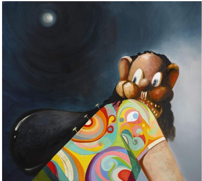
喬治·康多《遁世嬉皮士》 1998年作