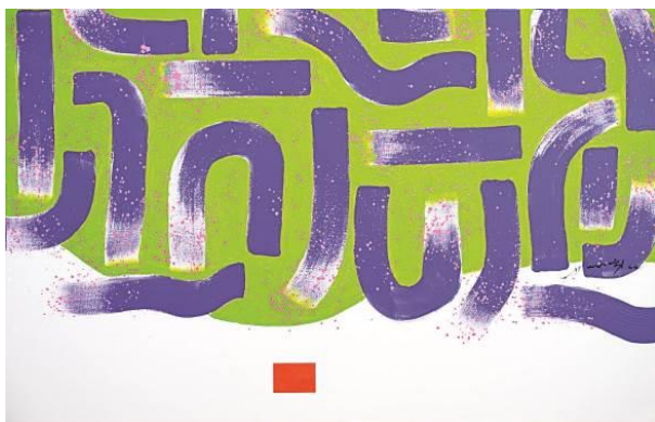
萧勤 《光之跃动 16》 1963 年作 压克力彩画布，90 x 140 公分 估价：500,000 至 800,000 港元 / 64,000 至 100,000 美元 (4 月 2 日晚拍，代表艺术家首次亮相于国际拍卖行之晚拍)

除了萧勤，本次现代亚洲艺术日拍尚呈献霍刚、李元佳、夏阳等「东方画会」响马的 1960、1970 年代作品，俱为海外征集所得，聚现战后华人力争上游，在国际画坛崭露锋芒的历史篇章。