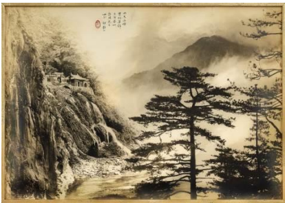
郎静山《东西横贯路》

4月3日举行之「光之绘画」特别呈献来自重要私人收藏的24帧郎氏作品，包括纪实、人物、静物、裸体，以及体现其最高艺术成就的「集锦」（composite pictures）与「影绘」（photogram）作品，横跨长达90年的创作生涯。从摄于1928年的中国史上第一幅裸体摄影《假寐》、1934年郎静山首幅「集锦」作品《春树奇峰》、乃至结合两岸三地景物、表达艺术家民族情怀的《烟波摇艇》，尽皆囊括其中。焦点还有分别由郁达夫及张大千题款的《危崖挺秀》和《黄山云海》，以及由郎氏亲题赠予蒋经国先生之《东西横贯路》，极富历史意义。