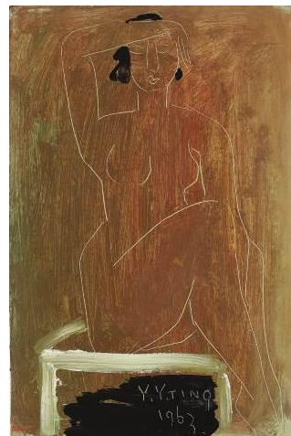
丁衍庸 《裸女 J》 1963 年作 油彩木板，45.8 x 30.4 公分 估价：500,000 – 700,000 港元 / 64,000 至 90,000 美元 (4 月 3 日日拍)

1960 年代，丁衍庸在香港中文大学新亚书院执教，随着生活逐渐安稳，他亦重拾多年来对玺印的爱好，此时诞生的《裸女 J》，即可见丁公引入篆刻灵感，先涂油彩、继而刮剔，以充满金石韵味的线条勾勒人物。本作出自比利时汉学家李克曼 (Pierre Ryckmans) 「无用堂」旧藏，李氏于 1960 年代到中文大学进修与执教，与丁公结下友谊，由是获得本作。其收藏之中国书画，已于去年香港苏富比中国书画以专题形式拍卖，如此珍贵可考的丁公油画，今春将结合其他纸上精品，于「现代亚洲艺术」日场一同亮相。