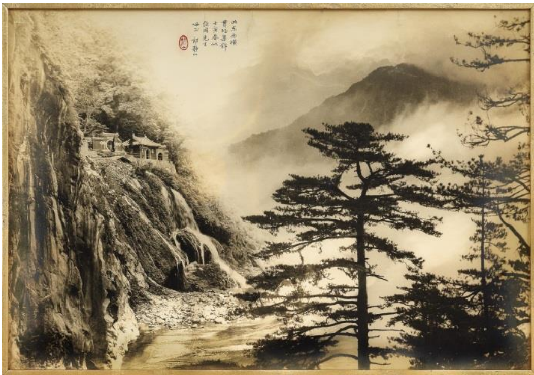
郎静山，《东西横贯路》，1962 年作，银盐相纸，34.2 x 49.4 公分 估价：200,000 至 300,000 港元 / 26,000 至 38,000 美元