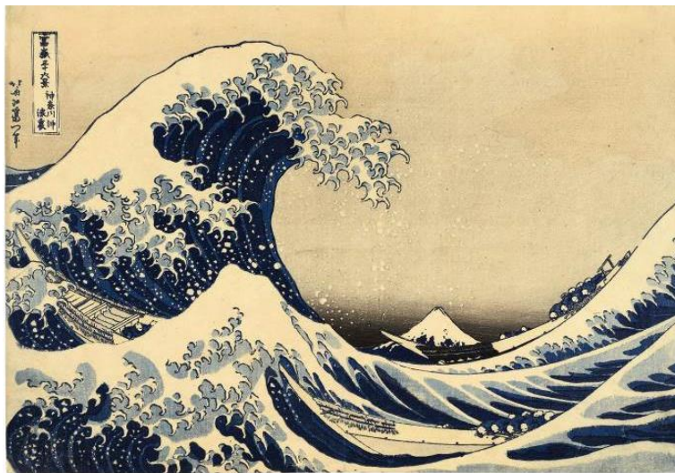
葛饰北斋 (1760-1849 年) 《富岳三十六景·神奈川冲浪里》，约 1831 年 估价：40 万至 60 万港元 / 51,500 至 77,500 美元*