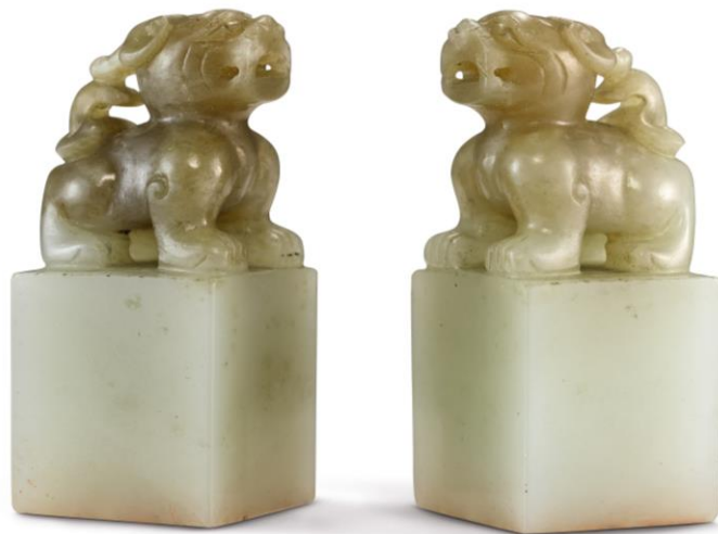
清道光 御制青玉瑞兽钮小玺一套两方 印文：道光御笔、政在养民 估价：200 万至 300 万港元 / 258,000 至 387,000 美元