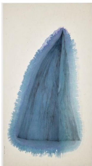
《半山》，1973 年作 设色纸本 174 x 95 公分