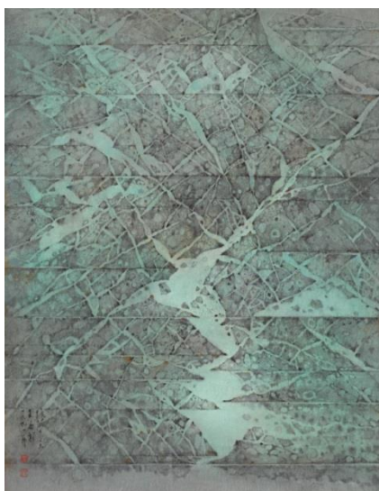
《故梦之三》，1991 年作 设色纸本 63 x 47 公分