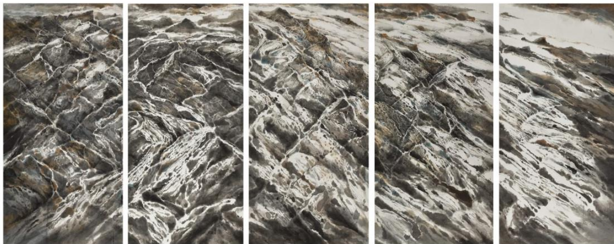
《意化山河》，2017 年作，设色纸本，142 x 69 公分（每幅）

画家王无邪、蘇富比当代水墨艺术主管唐凯琳及 香港中文大学文物馆署理馆长姚进庄教授将进行对谈