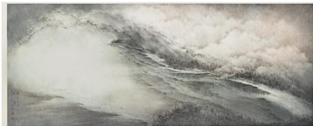
《湖光十六》，1990 年作 设色纸本，66 x 140 公分