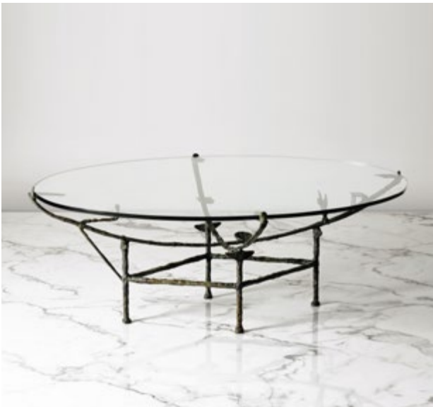
Table Carcasse à la chauve-souris, vers 1970 Bronze patiné et verre Estimation : 200.000-300.000 €