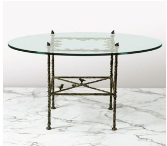
Table Feuilles aux oiseaux et grenouilles Bronze patiné et verre Estimation : 150.000-200.000 €