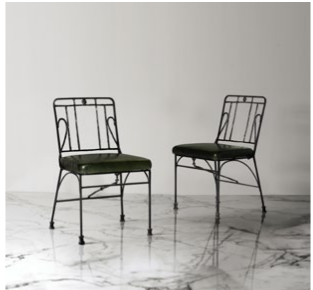
Paire de chaises Bronze patiné, fer et cuir original pour le coussin du siège Estimation : 100.000 – 150.000 €