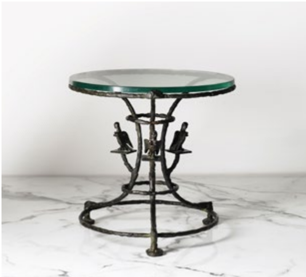
Guéridon aux harpies, vers 1970 Bronze patiné et dalle de verre Estimation : 70.000 – 100.000 €